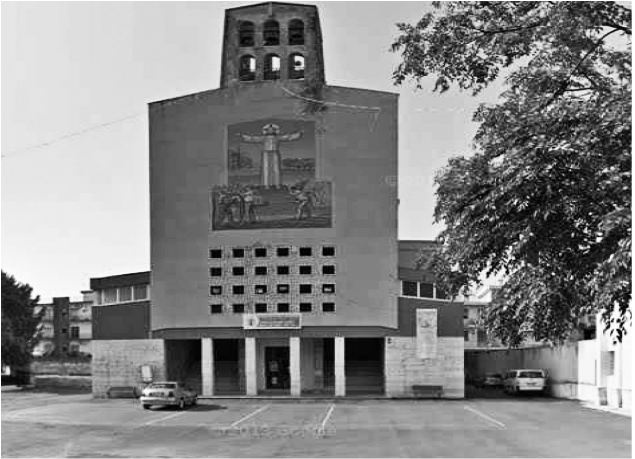
Foto 1: Parrocchia Cristo Lavoratore - Via Papa Giovanni XXIII - TRINITAPOLI